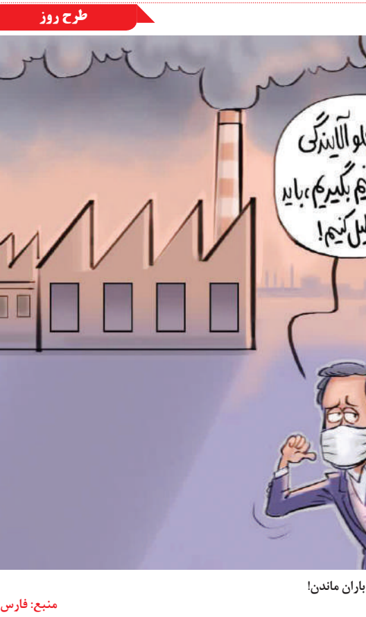
راه‌حل کلیشه‌ای مبارزه با آلودگی هوا؛ تعطیلی مدارس و منتظر باد و باران ماندن!

شدن شانه‌ها، گردن و صورت و دردی کرخت کننده می‌شود. شاید هم متوجه شوید این سردردها فقط گاهی هستند یا اینکه مزمن و تکرار شونده‌اند (۱۵ روز یا بیشتر در عرض یک ماه و به مدت سه ماه متوالی). سردردهای تشنجی برخلاف سردردهای میگرنی باعث اختلال بینایی یا تهوع نمی‌شوند. می‌توانید با ماساژ صورت به تسکین سردرد کمک کنید. پیشانی‌تان را با دست چپ ثابت نگه دارید و با انگشتان دست راستان، سمت راست پیشانی‌تان را ماساژ بدهید. با انگشتان بین ابروها ضربه‌های ملایمی بزنید. درد ابرو ناشی از عفونت سینوسی سرماخوردگی که از یکی دو هفته پیش شروع شده می‌تواند مزمن شود و التهاب و انسداد در حفره بینی ایجاد کند. با رشد باکتری‌ها، سینوس‌ها عفونت می‌کنند و علاوه بر دردی که در ابروها، دچار گرفتگی بینی، فشار صورت، سردرد، گلودرد و احتمالاً بوی بد دهان نیز خواهید شد. عفونت سینوس‌ها باید توسط پزشک تشخیص داده شود.