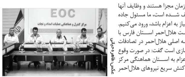
مدیرعامل جمعیت هلال‌احمر استان فارس:

نمی‌کند؛ زیرا دو سازمان مجزا هستند و وظایف آنها و به طور مجزا تعریف شده است، ما مسئول جاده نیستیم اما هر جا نیاز به اعزام باشد، ورود کنیم. مدیرعامل جمعیت هلال‌احمر استان فارس با تأکید بر این وظیفه اصلی هلال‌احمر در تصادفات راه‌سازی و روان‌سازی است گفت: در صورت وقوع تصادف در جاده با اعزام به استان هماهنگی مرکز پلیس‌راه، ایستگاه‌های راهداری و مجتمع‌های خدمات رفاهی جزو مواردی مورد تأکید ریس دادگستری است که احداث ساختمان‌های